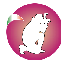
Federazione Fotografia Fenalc