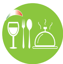
FICRE - FENALC Fed. Italiana Cultura e Ricerca Enogastronomica