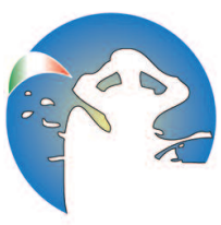
AIPGCA - FENALC Ass. Italiana per la promozione della Guardia Costiera Ausiliaria