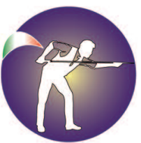
Federazione Biliardo Fenalc