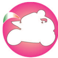
Federazione Motociclismo Fenalc