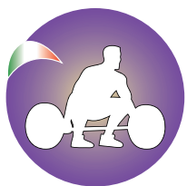
Fed. Sollevamento Pesì Fenalc