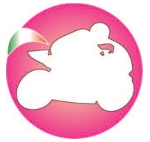
Federazione Motociclismo Fenalc