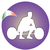
Fed. Sollevamento Pesì Fenalc