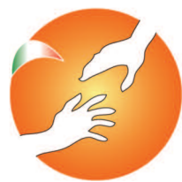
AIAPC - FENALC Ass. Italiana per l'Ausilio della Protezione Civile