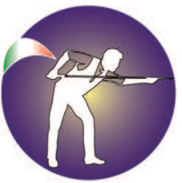
Federazione Biliardo Fenalc