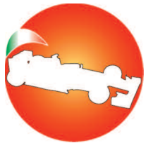
Federazione Automobilismo Fenalc