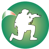
Federazione Soft-Air Fenalc