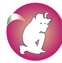
Federazione Fotografia Fenalc