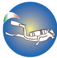
A.I.S.S. - FENALC Ass. Ital. Sportiva Subacquea