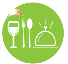
FICRE - FENALC Fed. Italiana Cultura e Ricerca Enogastronomica