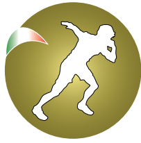
Federazione Lancio del Peso Fenalc