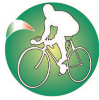
F.I.C. - Fenalc Federazione Italiana Ciclismo