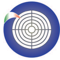
F.N.P.diT. - FENALC Fed.Naz.le Poligoni di Tiro