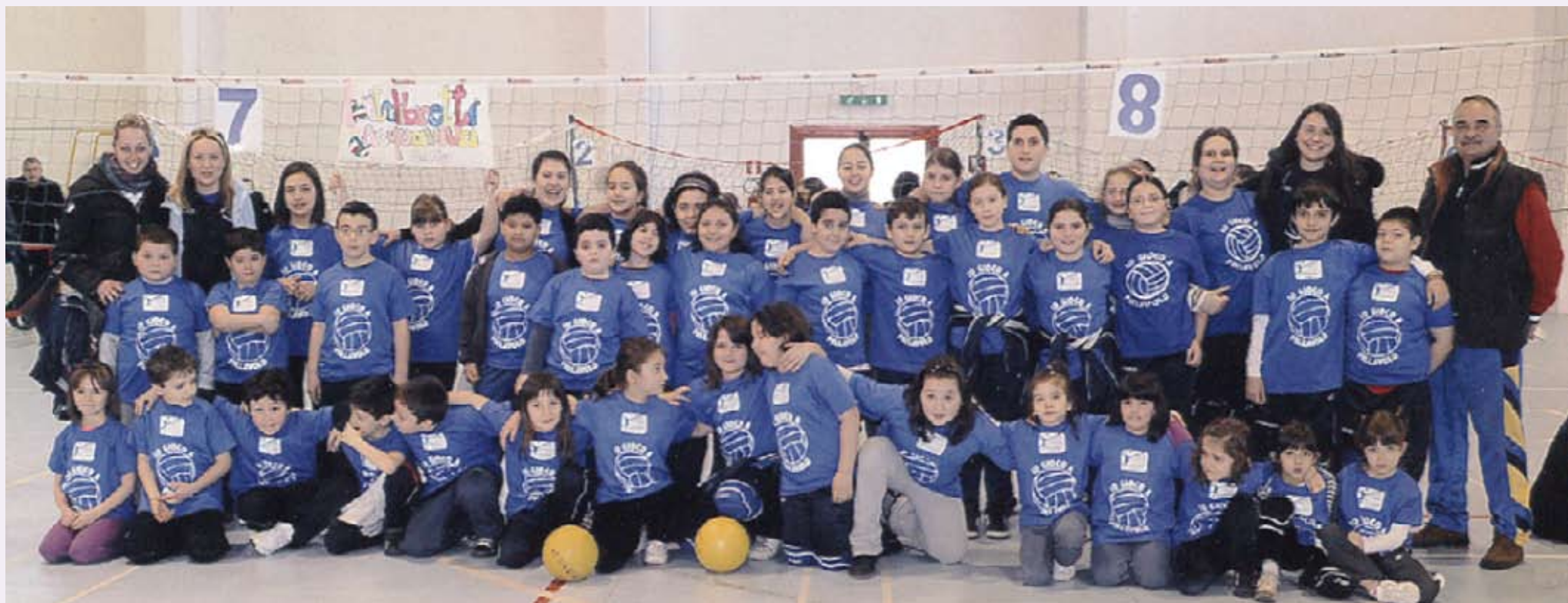
FORTITUDO VOLLEY - FENALC MONTELIBRETTI