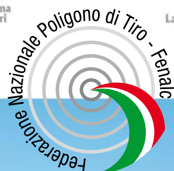
F.N.P. di T. - FENALC Federazione Nazionale Poligoni di Tiro