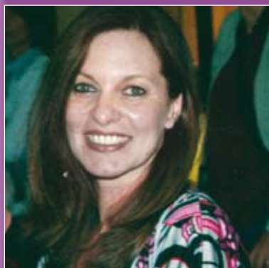
a cura della dott.ssa Nadia Loreti