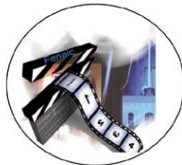
FNT&C - FENALC Federazione Nazionale Teatro e Cinema Fenalc