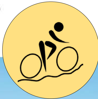
F.I.C. - FENALC Federazione Italiana Ciclismo