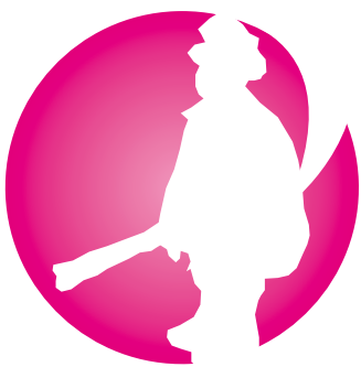
FIDC - FENALC Associazione Nazionale Cacciatori Fenalc

Fenalcl FEDERAZIONE NAZIONALE LIBERI CIRCOLI WWW.FENALC.IT